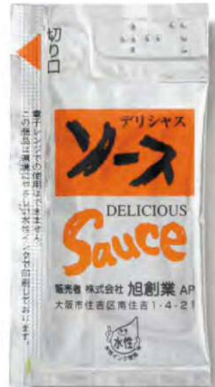
● 02450 点字シルバーソース 5g (500個×6箱) 約5g

■掲載の定番品の他、お好みの醤油・ソースでの別注充填も承ります。■オリジナルデザインでの別注フィルムも承ります。お気軽にご相談ください。