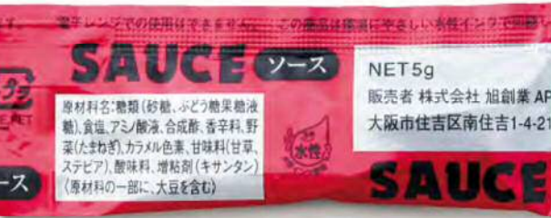
● 00331 シルバーソース 5g (500個×6箱) 約5g