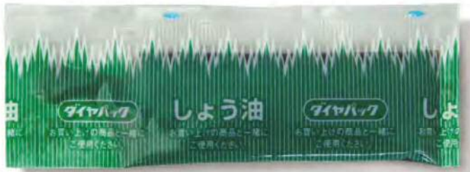
● 00109 スティック醤油 中 (500個×6箱) 約5g