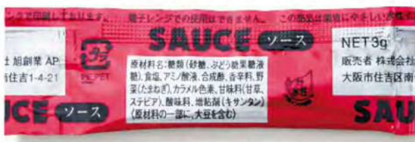
● 00330 シルバーソース 3g (750個×6箱) 約3g