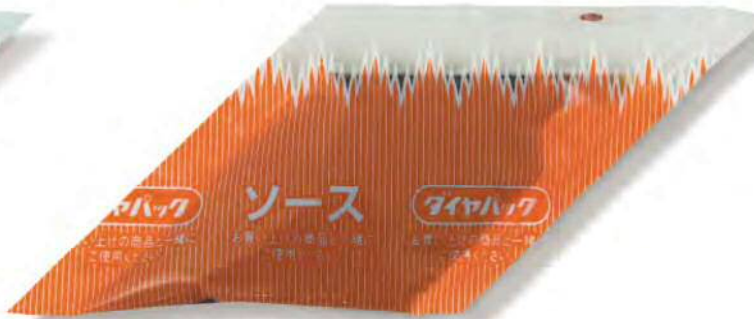
● 00301 ダイヤパックソース 中 (500個×6箱) 約5g