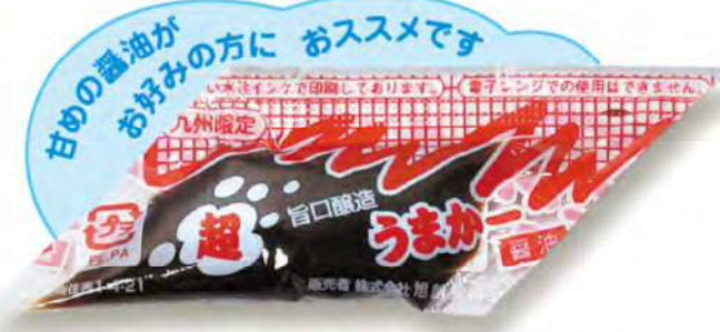
● 02406 ダイヤパック 超うま〜醤油 小 (750個×6箱) 約3g (賞味期限：6ヶ月)