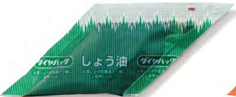
● 00101 ダイヤパック醤油 中 (500個×6箱) 約5g