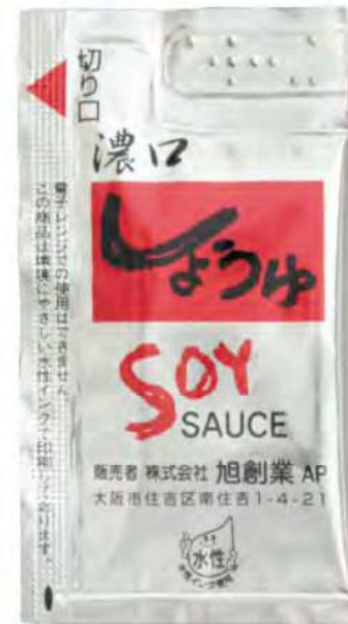
● 02400 点字シルバー醤油 5g (500個×6箱) 約5g