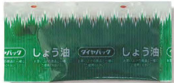
● 00110 スティック醤油 大 (350個×6箱) 約7g