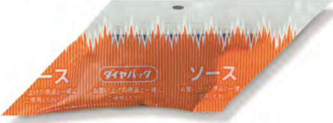
● 00300 ダイヤパックソース 小 (750個×6箱) 約3g