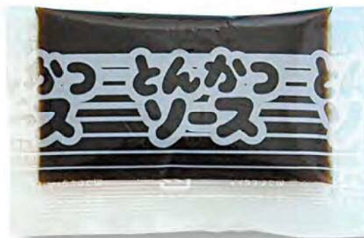
● 00195 旭ミニとんかつソース 10g (300個×4箱) 約10g (賞味期限：12ヶ月) ※この商品は色ロットはありません。 ※2014年2月 フィルムデザインリニューアル予定。