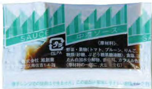
● 00306 中濃ソース 5g (500個×6箱) 約5g (賞味期限：6ヶ月)