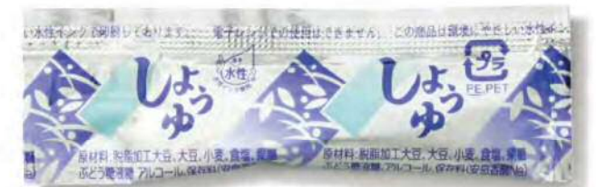
● 00130 シルバー醤油 3g (750個×6箱) 約3g