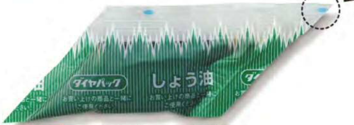
● 00100 ダイヤパック醤油 小 (750個×6箱) 約3g