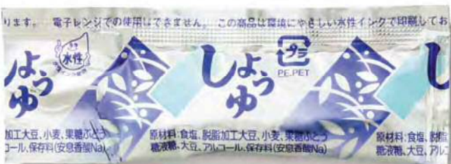
● 00131 シルバー醤油 5g (500個×6箱) 約5g